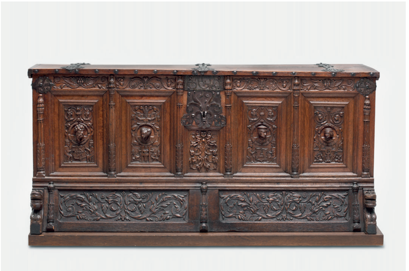
Truhe Norddeutsch, um 1550 Eichenholz, Eisen H. 88,0 cm, B. 182,0 cm, T. 76,0 cm Inv.-Nr. K-272 LM