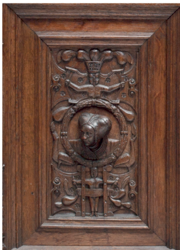
Abb. 1 und 2: Truhe (Details), Norddeutsch, um 1550. LWL-Museum für Kunst und Kultur, Münster, Inv.-Nr. K-272 LM