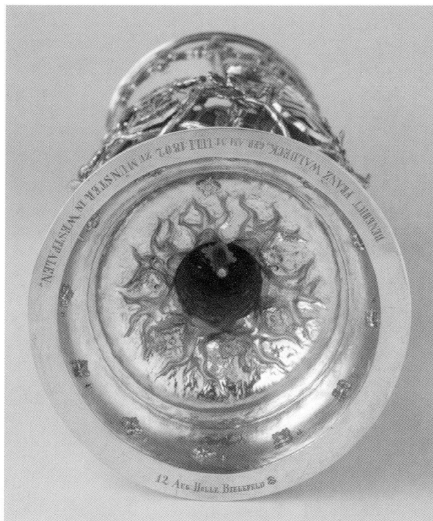
Abb. 1: Gravur unter der Fußkante